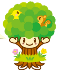
樹徳キャラクター「ピッパちゃん」